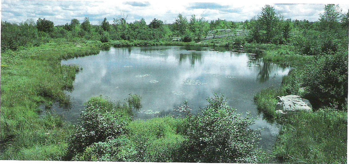
Figure 3.2 En s'évaporant des ruisseaux et des autres étendues d'eau, l'eau forme de la vapeur d'eau invisible.